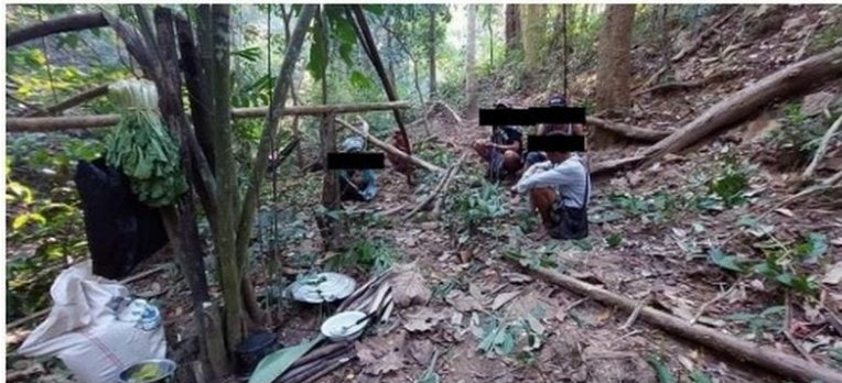
IDPs fleeing attacks, seek safety in the jungle

戦火を逃れ、洞窟やジャングルの中に身を潜める避難民の方々（撮影：2022年2月、カレン州）