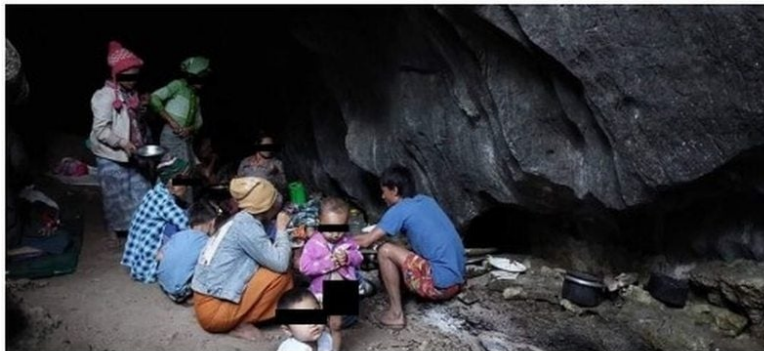
IDPs fleeing airstrikes in Kayin State hide in a cave

ミャンマーでは政治的な混乱が続いており、現在190万人もの人々が困難な状況に直面しています。特にADRAが活動するカレン州では、戦火を逃れている国内避難民は普段の食事さえままならず、命が危険にさらされています。